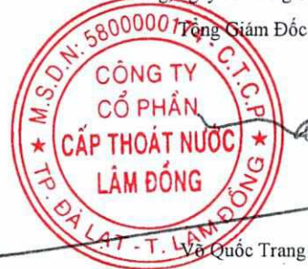
Vũ Quốc Trang